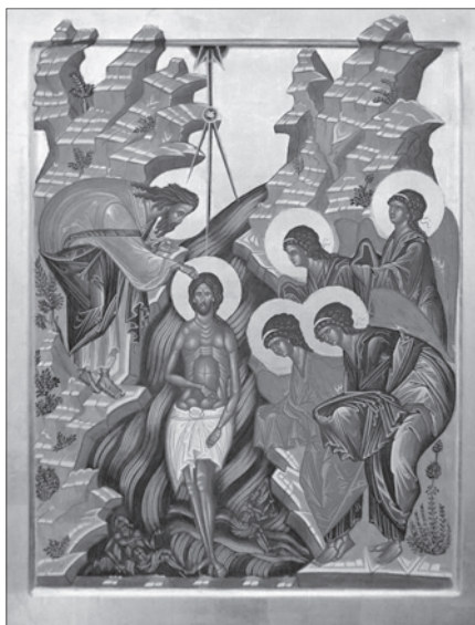
Святые Богоявление. Сийская иконописная мастерская.

Обрезание (один из ветхозаветных обрядов) было установлено в знамение Завета Бога с праотцем Авраамом. Явилось прообразом новозаветного крещения в знак очищения от первородного греха. Господь Иисус Христос, не имевший греха, не нуждался ни в каком очищении, однако принял обрезание, чтобы показать, что он не только Истинный Бог, но и Истинный человек, и чтобы указать, как неукоснительно надо соблюдать Божественное установление. Приняв обрезание, Господь получил имя Иисус, что означает Спаситель.